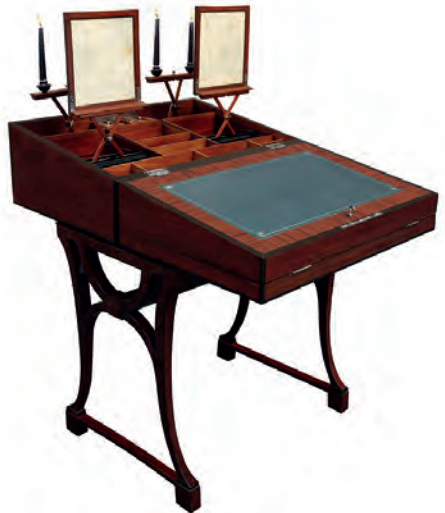
Höchst seltenes Reise-Verwandlungsmöbel Wien, um 1810

Eichenholzkorpus, Mahagoni furniert, lineare Obstholzintarsie, zweifach aufklappbares Salonmöbel auf geschweiftem Unterbau, Poudreuse mit Spiegel oder Sekretär mit lederbespanntem goldgeprägtem „ecritoire“, zwei herausziehbare zweiflämmige Kerzenleuchter, davor zwei Lichtschirmaquarelle auf Pergament mit Seidenumspannung von Balthasar Wigand, 100 x 72 x 48 cm signiert „Geul et Wigand (fegerunt), Wien“