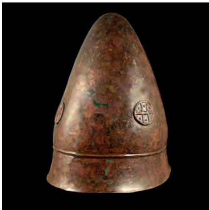
Hellenistischer Piloshelm 4. – 3. Jahrhundert v. Chr. aus Bronzeplatte geschlagen, mit spitz zulaufender Kalotte, Höhe: 24,2 cm