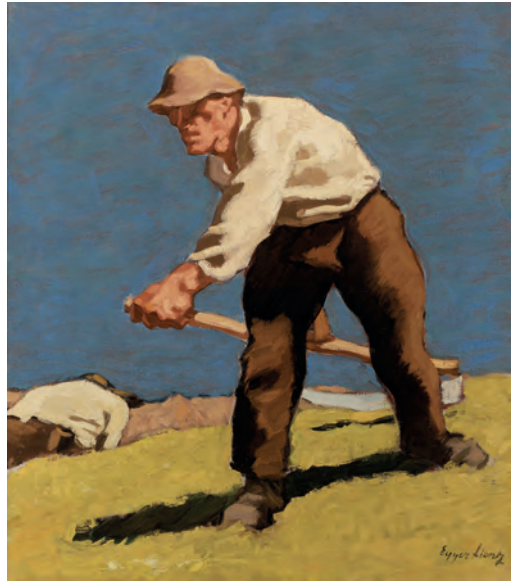
Albin Egger-Lienz „Zwei Mäher“, um 1920

Breslau/Schlesien, zweite Hälfte 17. Jahrhundert Bronze graviert und feuervergoldet, versilberte Bronzeapplikationen, vier verglaste Sichtfenster, Ziffernring versilbert, zentrale Weckerstellscheibe, Spindelgang mit Kette und Schnecke, durchbrochen gearbeiteter Unruh-Kloben, Feinregulierung, Stundenschlag auf Glocke mit Schlossscheibe, Wecker auf Glocke, 13 x 13 cm signiert "Johann Enghart Breslau" (auf der Platine)