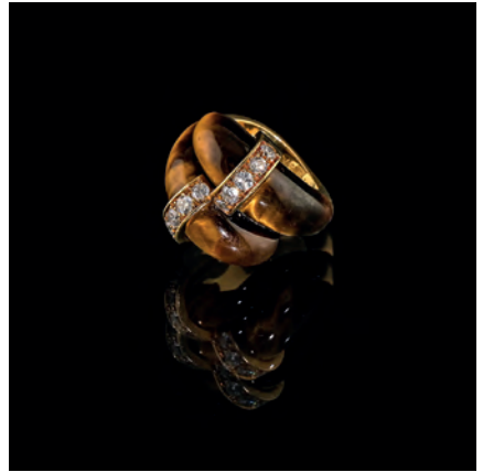
Ring by Piaget, importiert nach Frankreich, ca. 1970 18 Karat Gelbgold, Tigerauge-Quarz und Diamanten