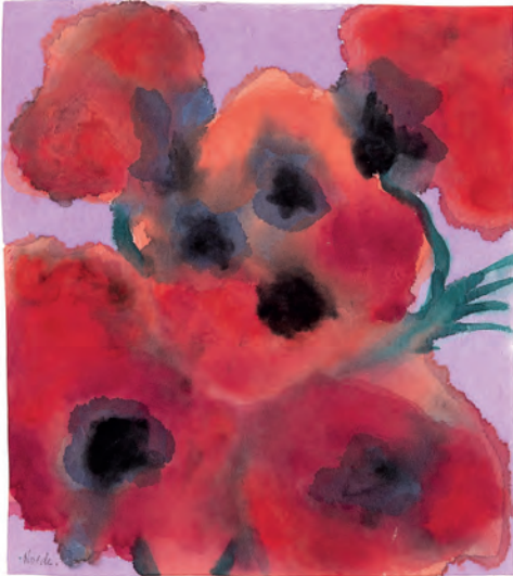
Emil Nolde „Mohnblumen“, um 1930/1940 Aquarell auf Japanpapier, 27,5 x 24,6 cm links unten signiert: Nolde. Bild: Galerie Sylvia Kovacek, © Bildrecht, Wien 2025